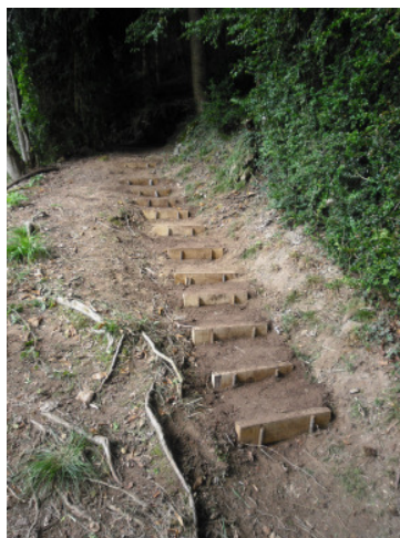
Kleine Treppe ...