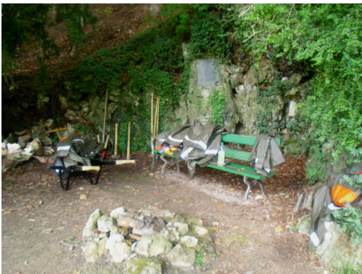
Materiallager vor dem Denkmal

Als Erstes eine neue Treppe bauen, damit der Wanderweg wieder mit der dortigen Strasse verbunden wird. Zweitens, das Roden und Freilegen des Tufferenwegs samt der dahinter liegenden Tuffsteinmauer und drittens das Erstellen einer neuen Brücke über den zur Zeit trockenliegenden Grubenbach.