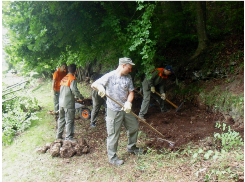
Teamarbeit am Paradiesliweg

Da im Jahr 2012 an diesem Ort das Sommertheater Gürbetal stattfinden wird, ist es höchste Zeit diesen Zustand zu ändern.