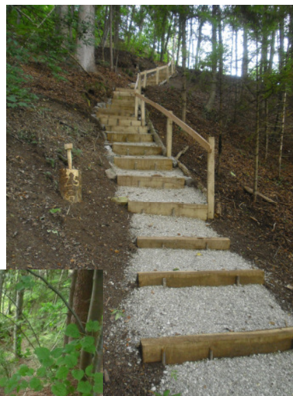
Grosse Treppe ...