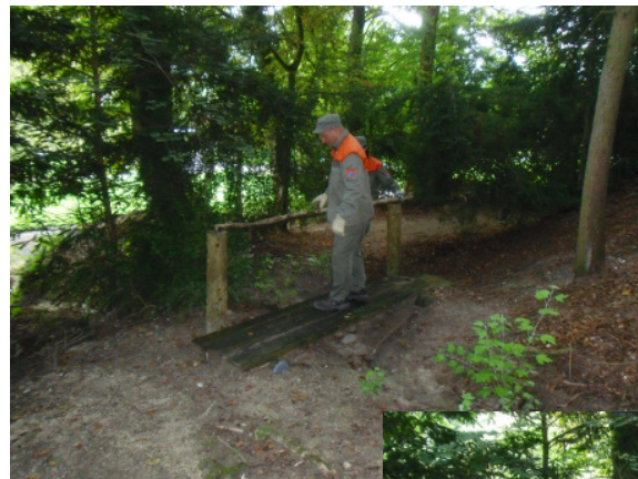
Vorher - Nachher