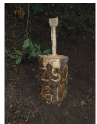
...Gute Arbeit- Bravo !