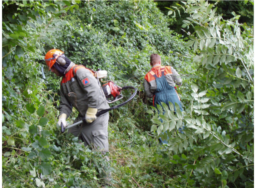
Vorher: Mit Motorsäge und Motormäher kämpft sich das Team Meter um Meter durch das grüne Dickicht vorwärts

Ausgerüstet mit Motorsäge, Motormäher und verschiedenen Hilfswerkzeugen ging die Mannschaft am Nachmittag voller Tatendrang an die Arbeit.